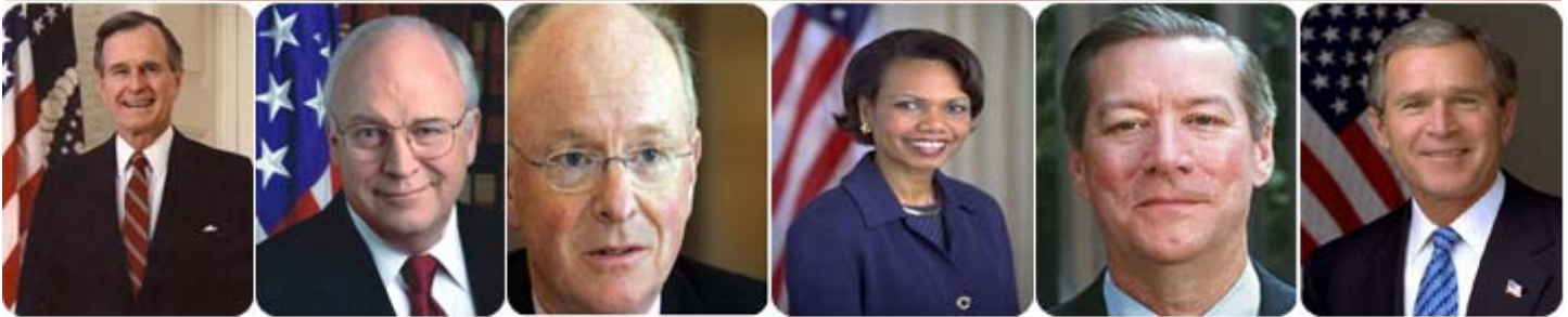
George Bush Sr.