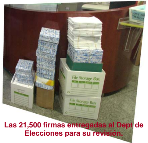
Las 21,500 firmas entregadas al Dept de Elecciones para su revisión.

Por ejemplo —nos instruye Gregorio Rodríguez— antes del alza desmesurada de los impuestos a la propiedad, yo pagaba en mi negocio $ 2,000 al año y ahora la carga impositiva es de $ 13,000. Ese aumento no hay quien lo aguante y es el culpable de nuestra crisis económica. El Estado de La Florida, quien no recibe un centavo de estos impuestos, tiene un déficit de 2mil millones, debido a la peligrosa baja en impuestos a las ventas, que