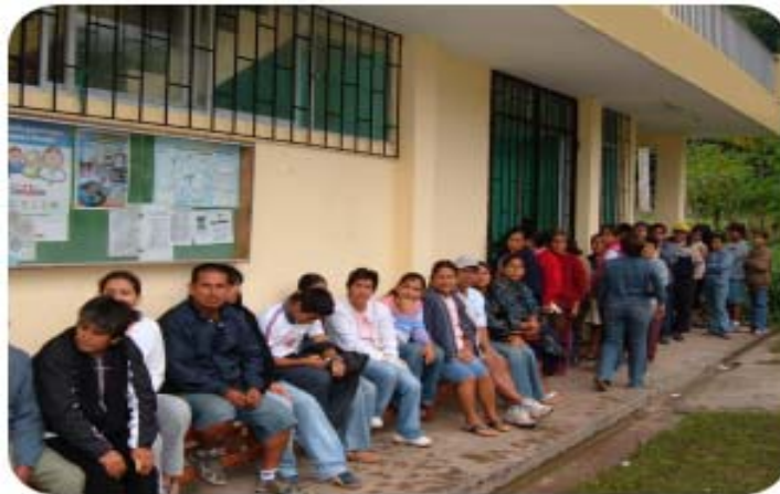
La cola en el consulado de España en Caracas comienza desde la madrugada...

Quienes están dentro de esa categoría, tienen la opción — no ya del asilo político — de la nacionalidad española, con todos los inimaginables beneficios que esto supone. Las autoridades de inmigración de Estados Unidos están al tanto de la existencia de esta nueva ley que lleva años gestándose y que por fin entró en